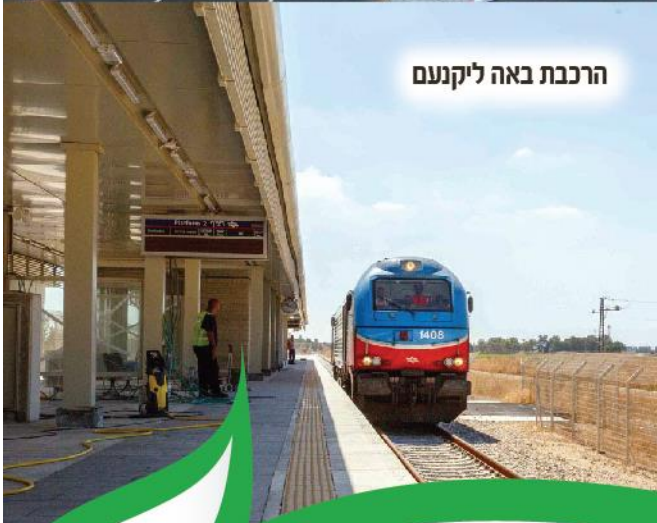
הרכבת באה ליקנעם