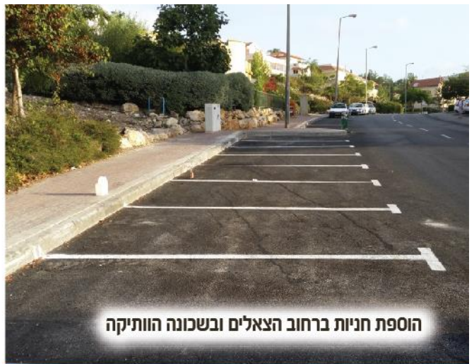
הוספת חניות ברחוב הצאלים ובשכונה הוותיקה