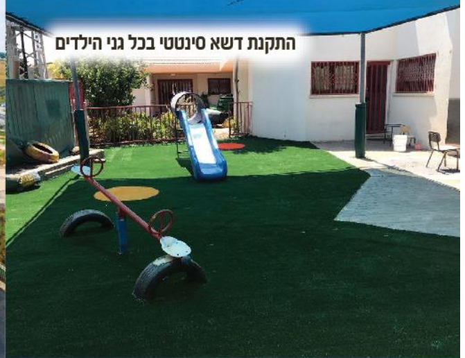
התקנת דשא סינטטי בכל גני הילדים