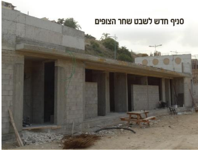
סניף חדש לשבט שחר הצופים