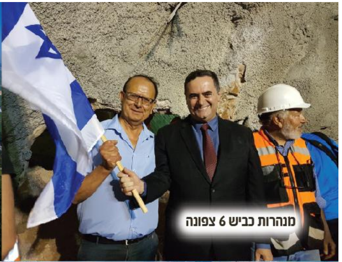
מנהרות כביש 6 צפונה