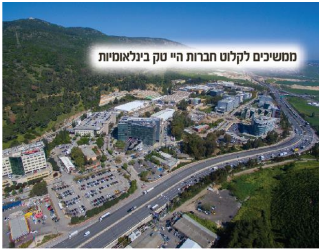
ממשיכים לקלוט חברות היי טק בינלאומיות