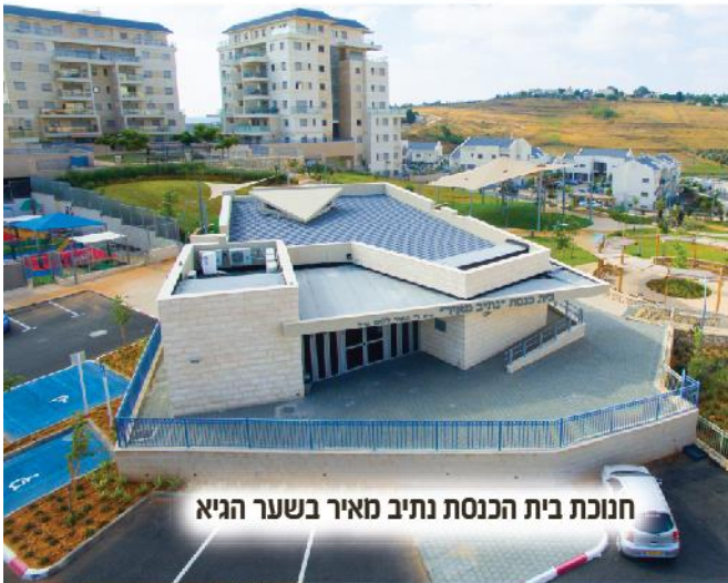
חנוכת בית הכנסת נתיב מאיר בשער הגיא