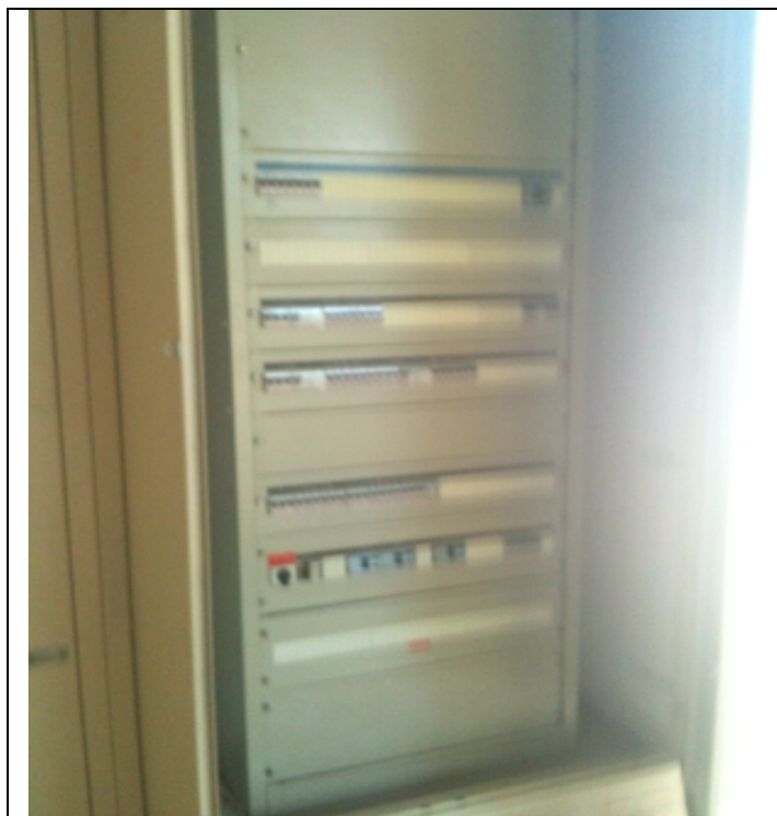
לוח החשמל ליד הקבלה