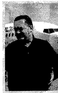
שר התחבורה ישראל כץ

בהחלטת הממשלה נאמר, כי "בהמשך לעבודת המטה שנעשתה על ידי משרד התחבורה והבטיחות בדרכים ורשות התעופה האזרחית, ובשים לב לחלופות למיקום שדה תעופה המשלים שהועלו בעבר, מחליטה הממשלה, על פי התשתית העובדתית הקיימת, כי המיקום המועדף להקמת שדה תעופה משלים הוא במרחב בסיס רמת דוד והשטחים הסמוכים הנדרשים לשם הקמתו ותפעולו של שדה התעופה המשלים".